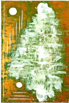
"Purezza ed equilibrio"