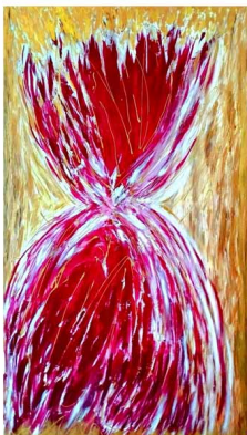
"Miscela di energia"

- astratto - acrilico, spatolato. - cm 100x175.