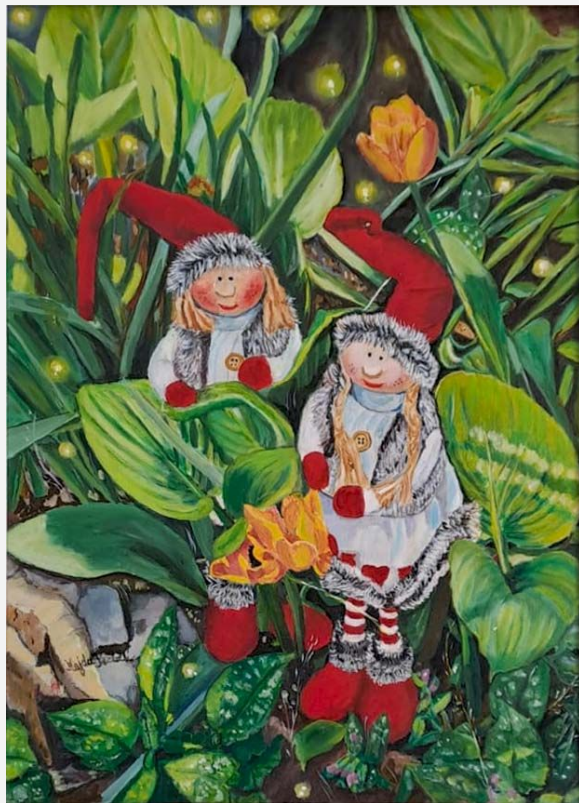
"Gnomi con le lucciole" - 2019 - olio su tela - cm 25x35