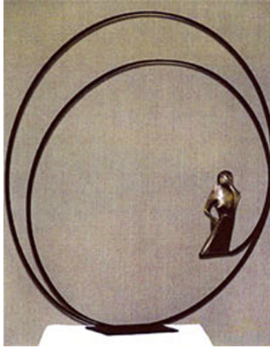
scultura in bronzo