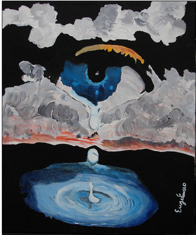
"L'occhio del mondo" - acrilico su tela