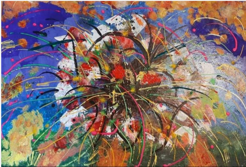
"Fuochi d'artificio" - - acrilico su tela -