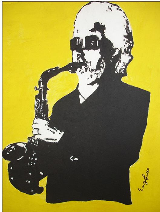
"Autoritratto" - acrilico su tela

L' artista sperimenta diversi materiali, dai colori acrilici all'uso dei colori ad olio, utilizza la tecnica d'incisione e della pirografia che gli permette di evidenziare contorni netti su legno. I supporti scelti variano dalla tela al cartone telato, al legno.