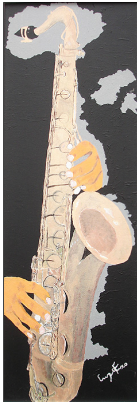
"Le mani sul sax" - 2014 - acrilico su tela