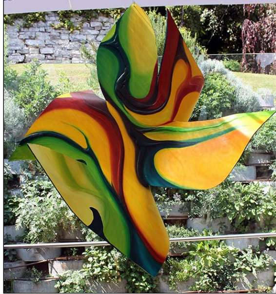
mista su tavola - cm 70x70