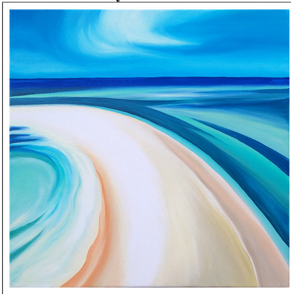
olio su tela - cm 40x40

L'artista Regina Anzalone inizia ad esporre le sue opere in mostre personali dall'anno 2016 ricevendo consensi da un vasto pubblico internazionale. Realizza diverse installazioni con la collaborazione del maestro Luigi Turati sul tema della multisensorialità e della sintesi fra le arti.