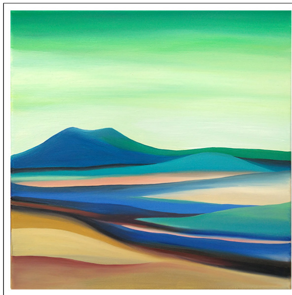
olio su tela - cm 40x40

PRESENTAZIONE CRITICA ALL'ARTISTA REGINA ANZALONE