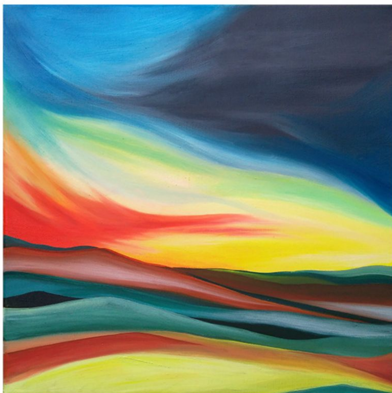
"Meteoropatia" - 2017 - olio su tela - cm 40x40