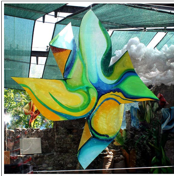
mista su tavola - cm 70x70

Ha partecipato a diverse collettive, tra le quali: