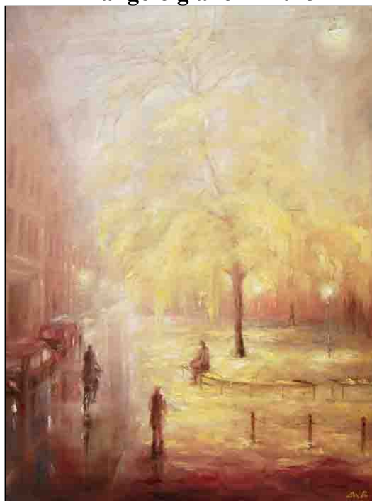
olio su tela - cm 60x80