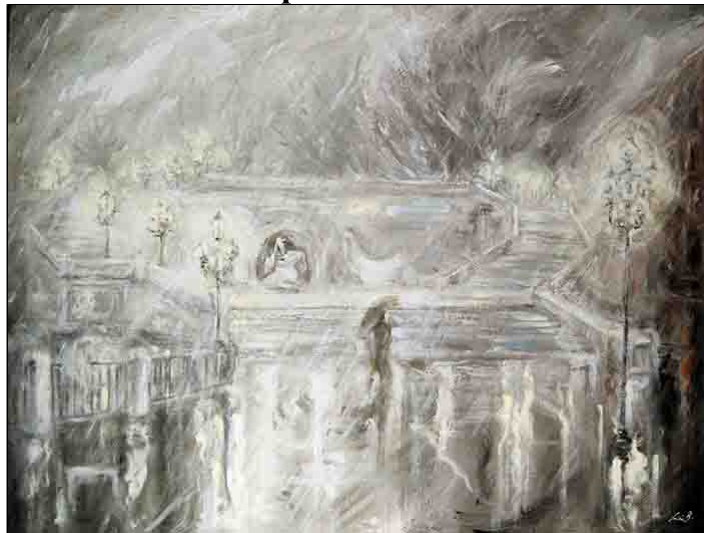
acrilico e gesso su tavola - cm 80x70