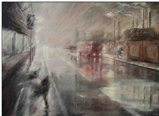
acrilico su tela - cm 90x65