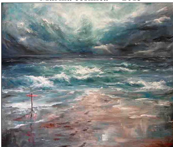
acrilico su tela - cm 120x100

Guarda il video delle opere di Licia Battarra su youtube..