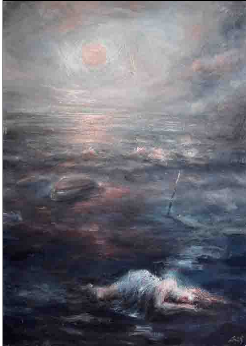
acrilico e gesso su tela - cm 50x70