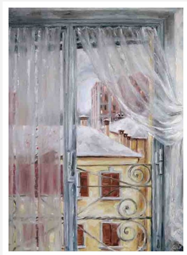
"Il lato a Nord-Est" - 2019 - olio su tela - cm 50x70