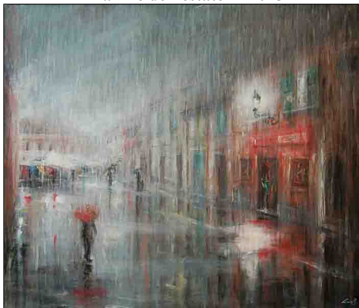
acrilico su cartone telato - cm 70x60