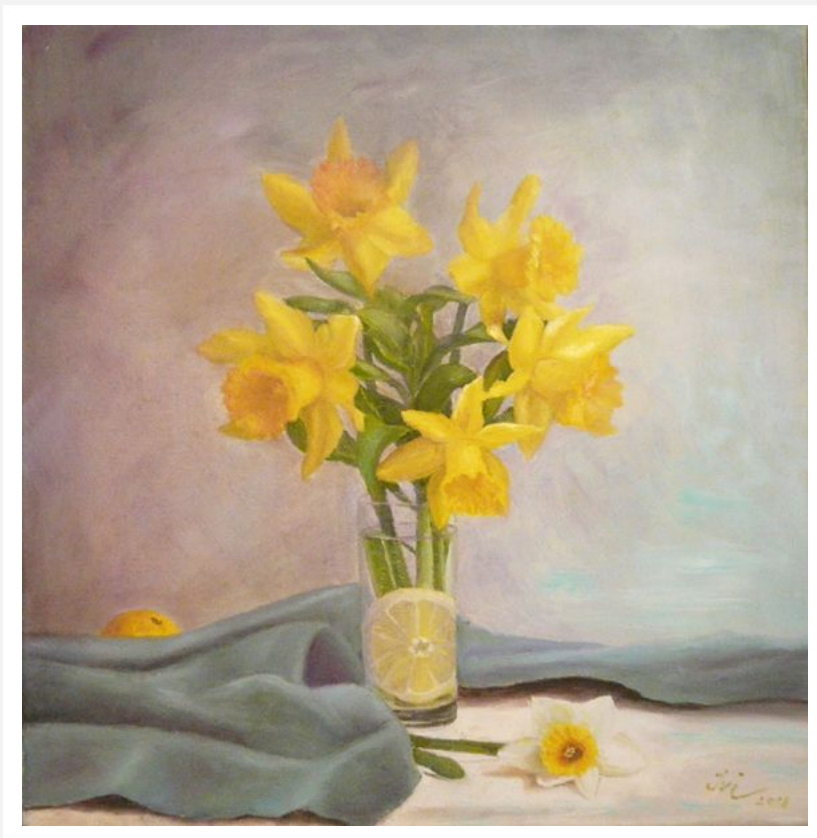
"Narcisi" - 2018 - olio su tela - cm 40x40