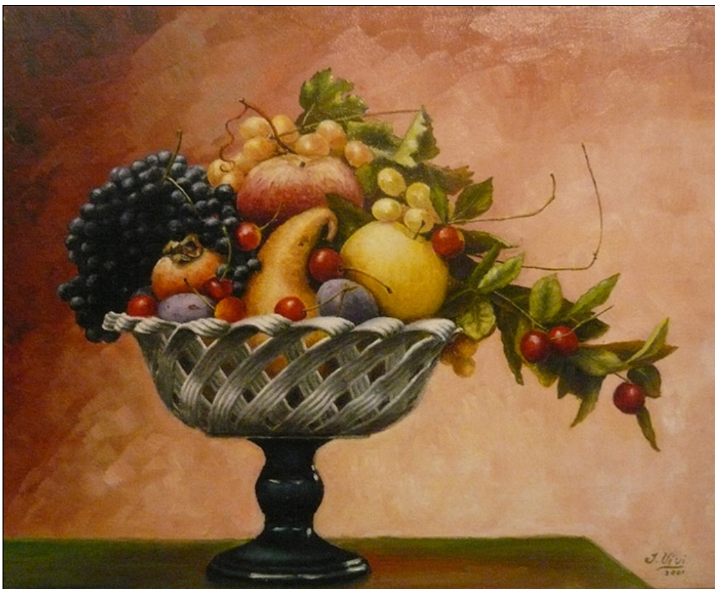
olio su tela - cm 50x40 - pezzo unico.