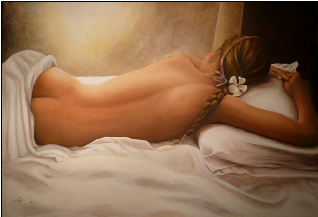
olio su tela - cm 100x70 - pezzo unico.