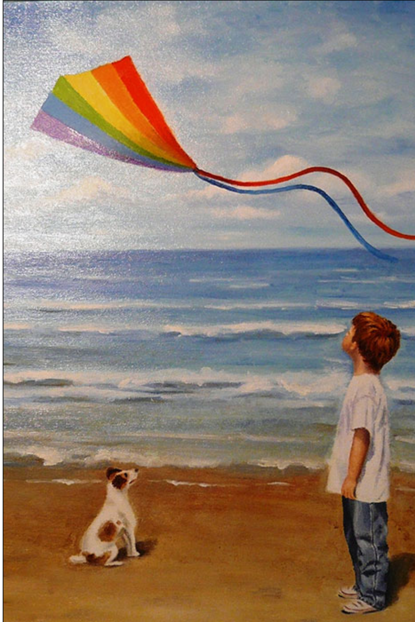
olio su tela - cm 50x70 - pezzo unico.

La forza creativa ed il raffinato linguaggio artistico si coniugano perfettamente con il valore dell'arte contemporanea, l'attività artistica ed espositiva di Ivi è accolta con rispetto ed ammirazione da collezionisti, estimatori e critici d'arte.