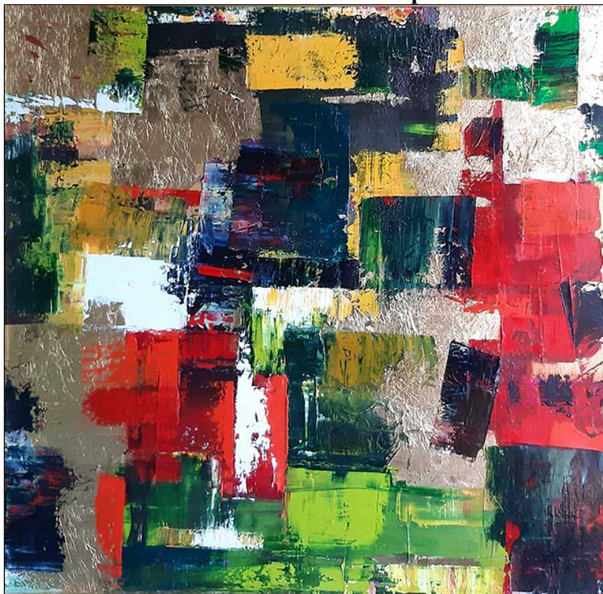
olio e foglia oro su tela - cm 80x80