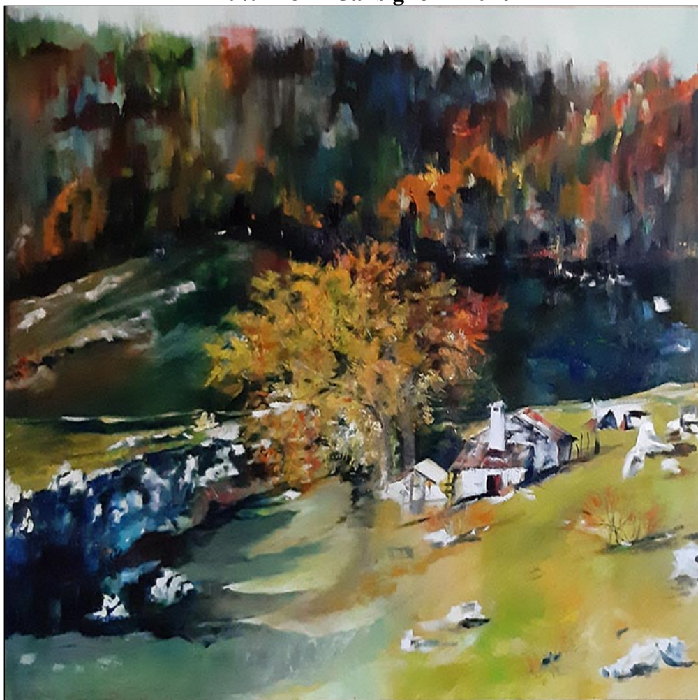
olio su tela - cm 100x100