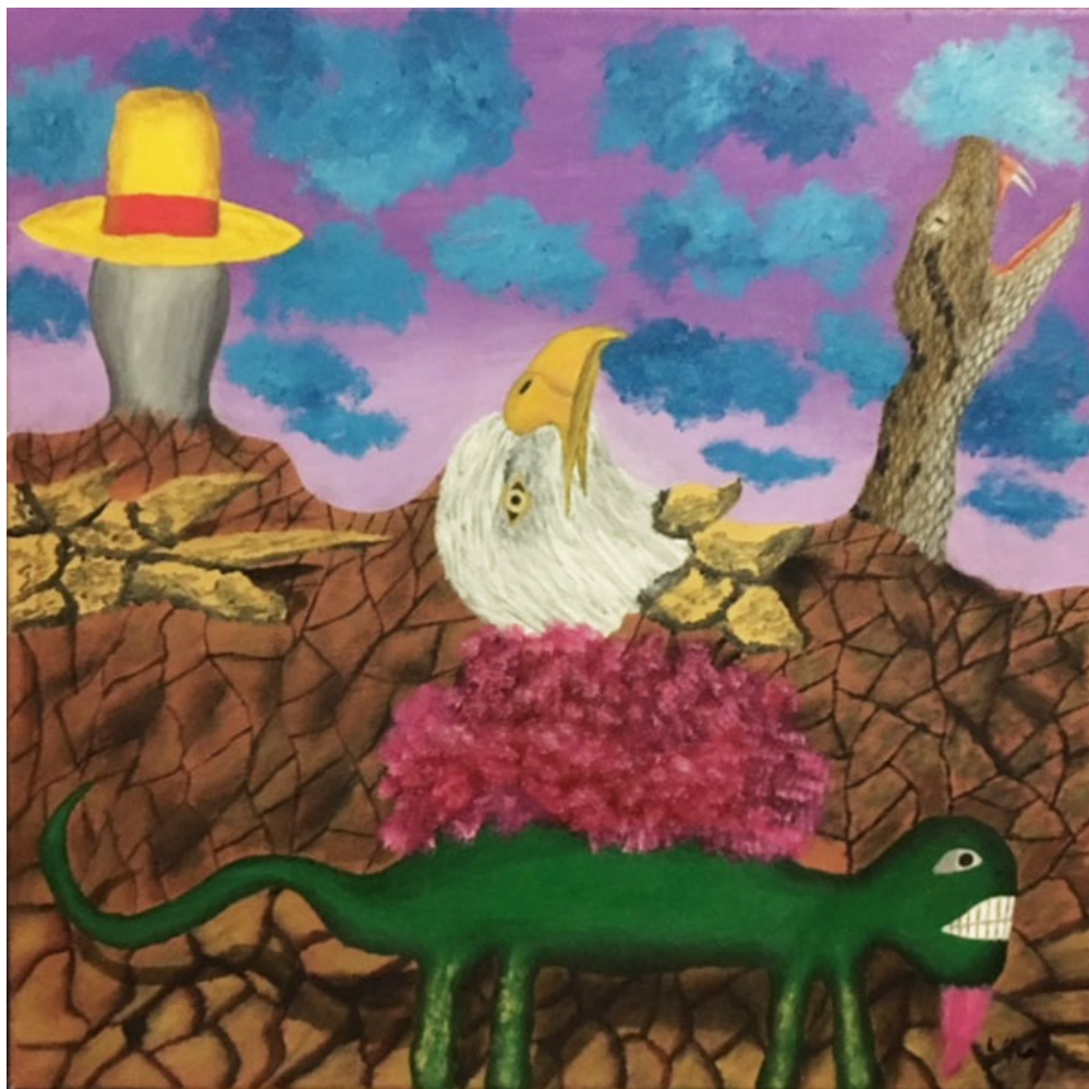
olio su tela - cm 50x50