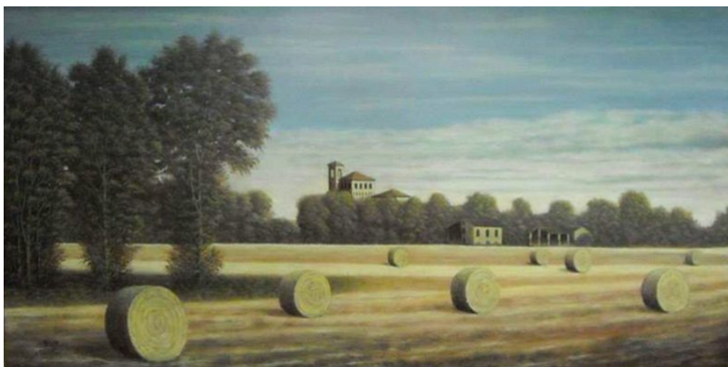
"Dopo la mietitura" - 2014 - olio su tela - cm 80x40