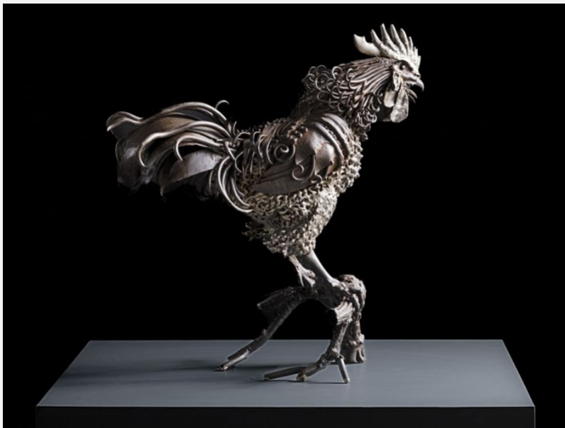
"Gallo" - 2015 - ferro, acciaio inox - cm h30xb63