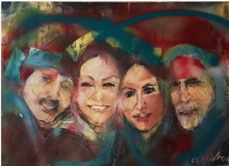
"Volti" - - olio su tela -