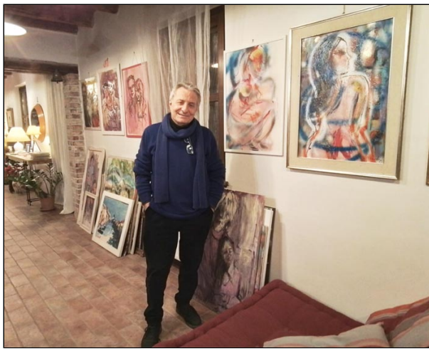
"Autoritratto in viola" - olio su tela