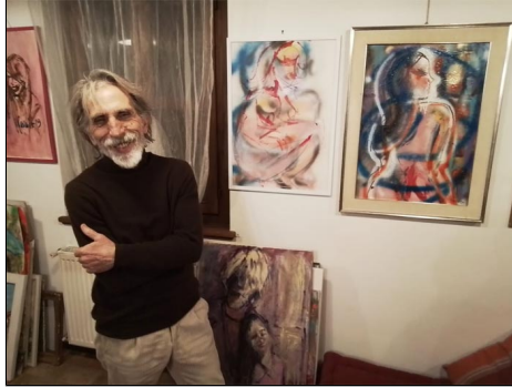
"Autoritratto" - olio su tela