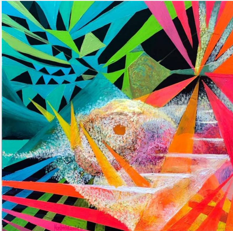
"L'attesa del divenire" - 2020 - mista su tela - cm 100x100